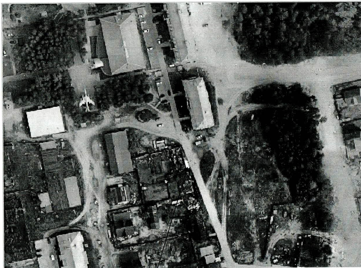
Место (площадка) накопления ТКО

4. город Югорск, район Югорск-2 (около дома № 6), площадь 18 м 2 , географические координаты (ширина/долгота): 61.274001, 63.154234