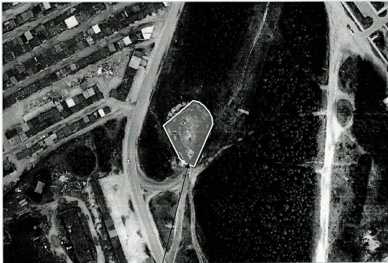
Место (площадка) накопления ТКО

город Югорск, улица Газовиков – Промышленная, площадь 1 454 м 2 , географические координаты (ширина/долгота): 61.307470, 63.338418