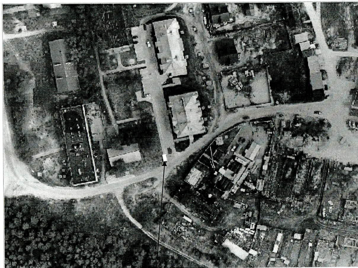
Место (площадка) накопления ТКО

5. город Югорск, район Югорск-2 (около дома № 8), площадь 12 м 2 , географические координаты (ширина/долгота): 61.272569, 63.152441