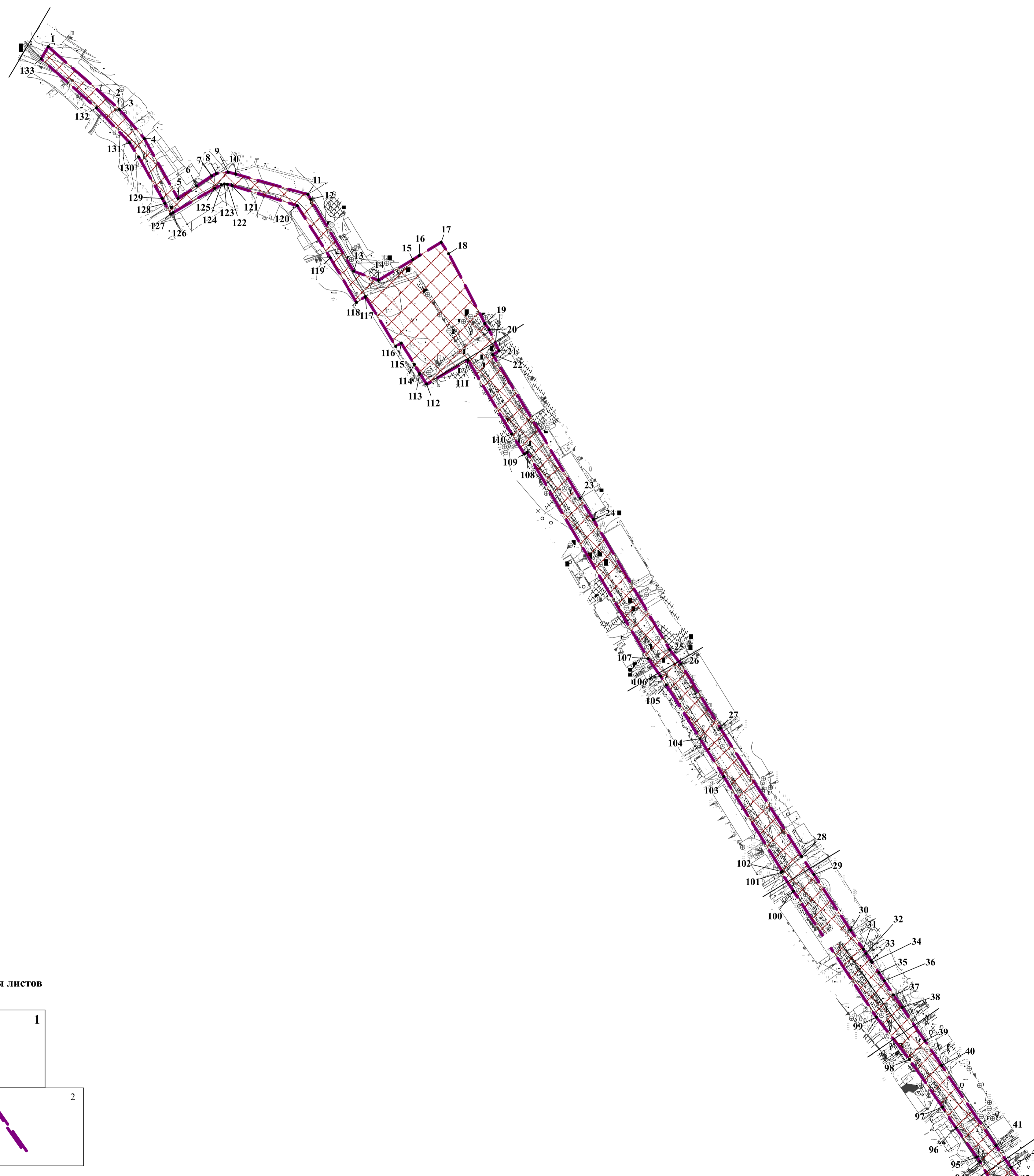
Схема расположения листов